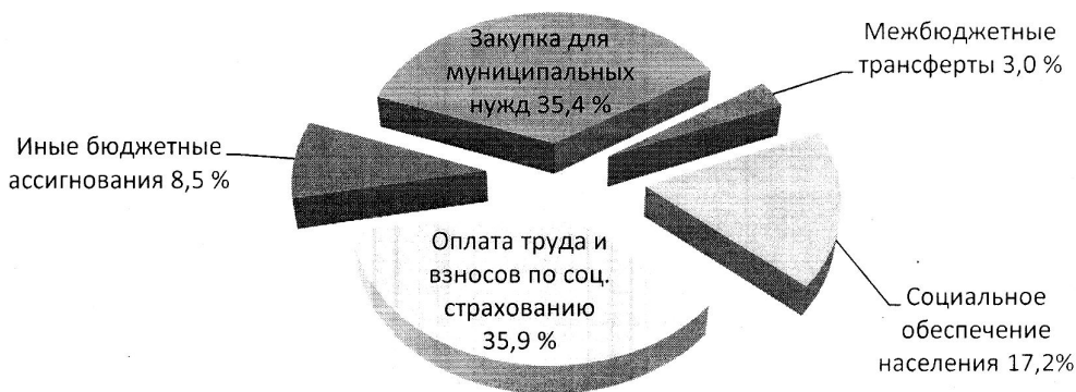
Рис. 3. Экономическая структура расходов бюджета Дубовоовражного сельского поселения за 9 месяцев 2023 года

Экономическая структура расходов бюджета поселения характеризуется следующими показателями (рис.3):