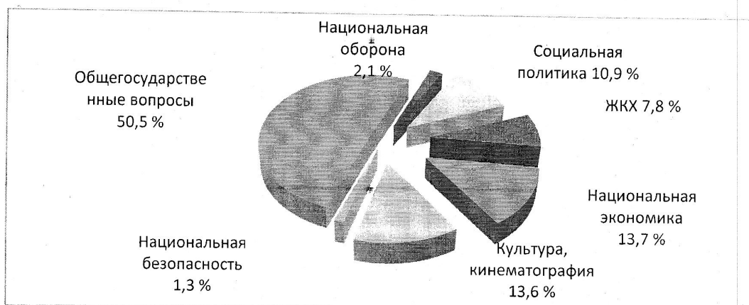
Рис. 2. Структура расходов бюджета Дубовоовражного сельского поселения за I полугодие 2025 года

Структура расходов бюджета Дубовоовражного сельского поселения за I полугодие 2025 года по разделам классификации бюджета представлена на рис.2